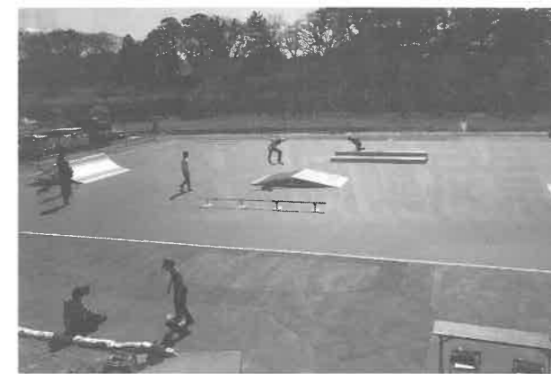
「リリースペイントHG」を塗布したローラースポーツ場

—— 機能商品とは具体的にどんなものですか 機能商品事業では、防虫分野と景観分野という2つの事業に注力しています。